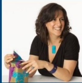
Port St. Lucie, FL