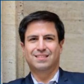
Moreno Valley, CA