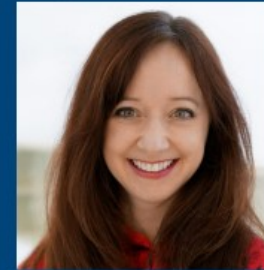
Ft. Lauderdale, FL