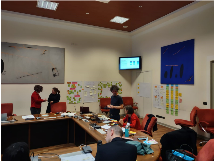
Il team al lavoro con il design thinking