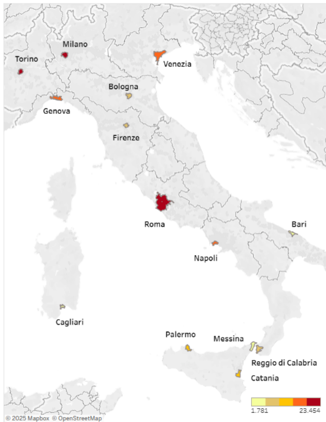
Territorio - Numero di sezioni del censimento

Elaborazioni a cura dell'Ufficio di Statistica del Comune di Bologna su dati pubblici Istat. Per maggiori informazioni ->